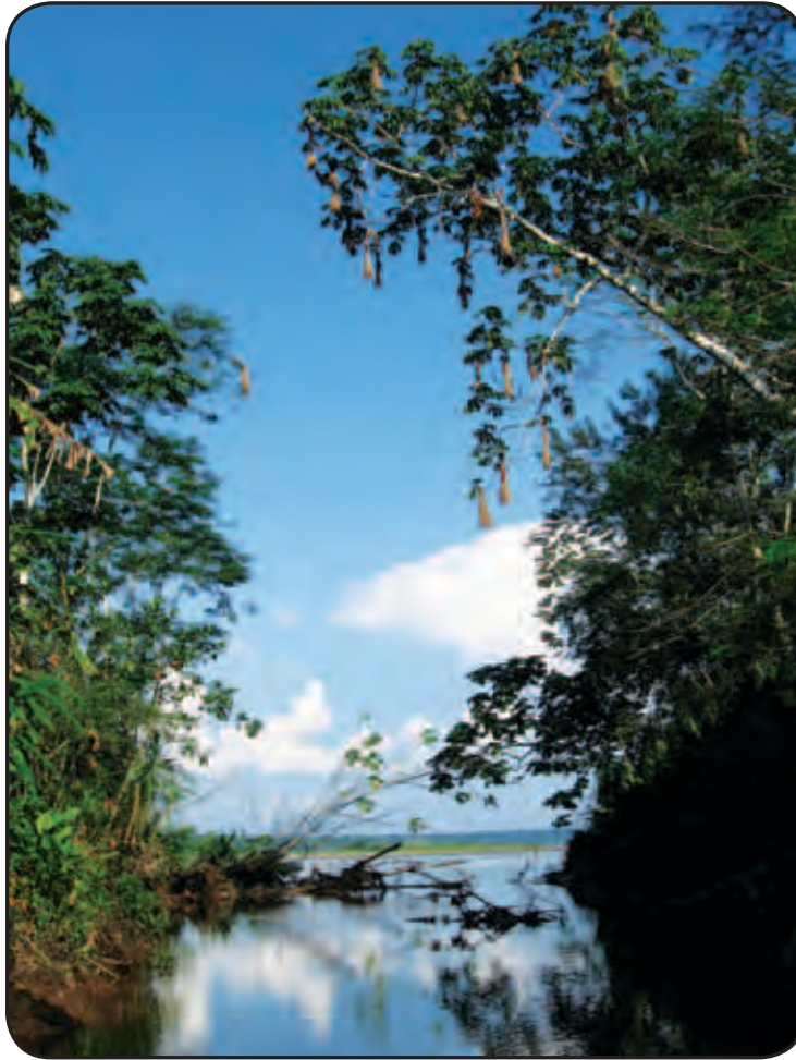
Bosques de galería, Río Napo, quebrada Chingana, Perú.