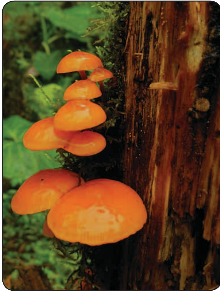
Agaricus sp., Basidiomycota. Rio Lelia, Santo Domingo de los Tsáchilas, Ecuador.

Actividades del Proyecto Regional UICN-PNUMA/GEF-ABS-LAC y contexto de los elementos críticos