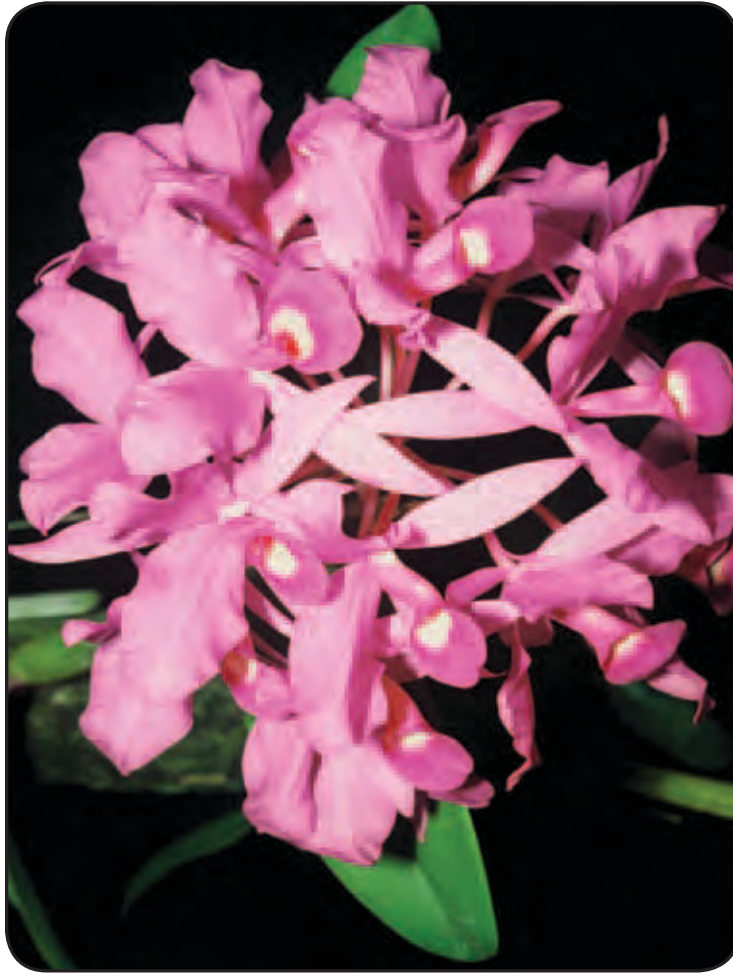
Cattleya skinneri , Turrialba, Costa Rica.