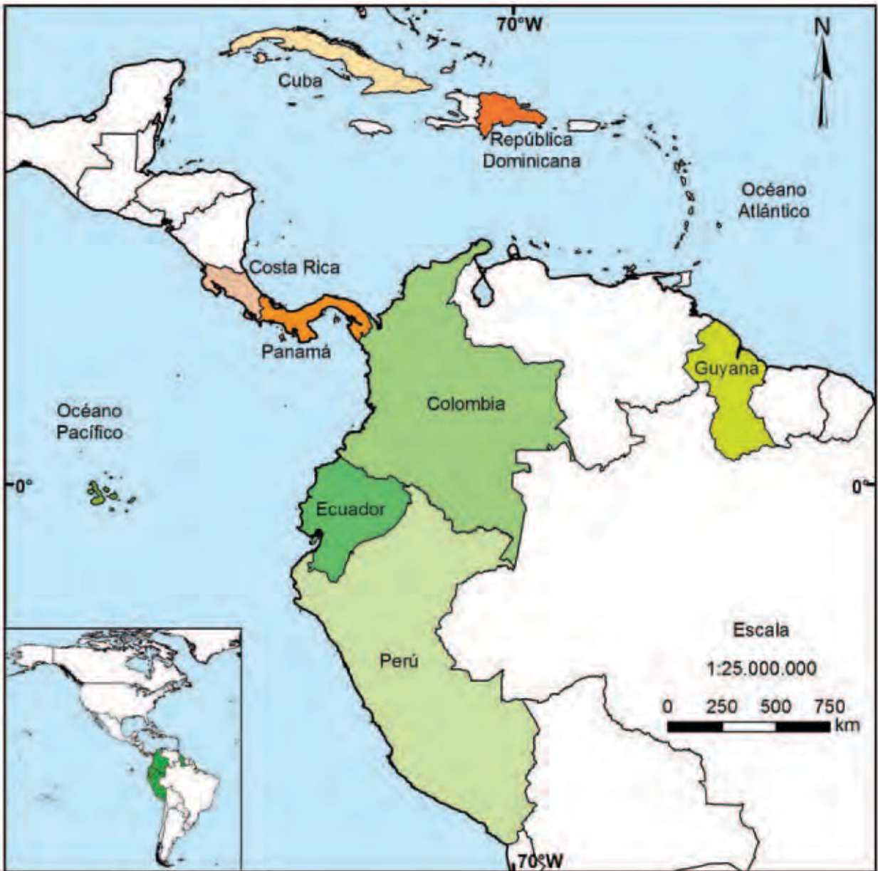
Acceso a recursos genéticos en América Latina y el Caribe: implementación del Protocolo de Nagoya a nivel nacional